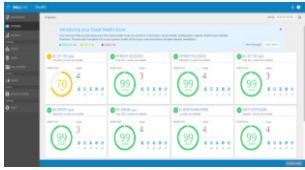
Упреждающая оценка состояния