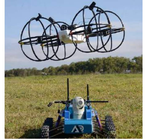
Австралийские роботы Explora компании Droid + Robot для подземных проверок оснащены технологией BreadCrumb компании Rajant

Примером может служить робот Explora для картографических и контрольно-измерительных операций производства компании Droid + Robot, который оснащен технологией BreadCrumb Rajant, позволяющей проводить независимые визуальные осмотры, получать тепловизионные изображения, выполнять лазерное сканирование, измерение газа и другие задачи по идентификации и/или эксплуатации в опасных условиях работы в шахте. Сеть Rajant также уникальным образом позволяет этим автоматическим системам связываться с транспортным средством для создания автономной ячеистой сети для управления их перемещением по всей шахте.