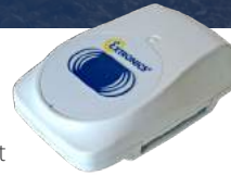
Метки RFID Extronics AeroScout на базе Wi-Fi поддерживаются сетью Rajant

Rajant сотрудничает с Extronics для поддержки активных меток RFID AeroScout на базе Wi-Fi для отслеживания персонала и объектов. Поскольку соединение по сети Rajant никогда не прерывается во время передачи данных, обеспечивается высоконадежное отслеживание персонала и материальных активов, которое может также использоваться для выявления проблем производительности в режиме реального времени для повышения эксплуатационной эффективности.