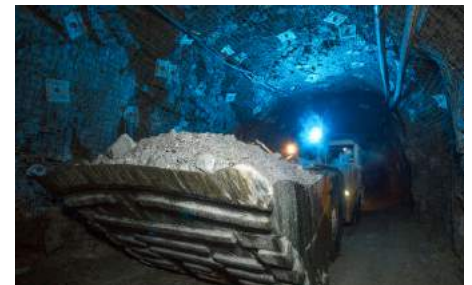
Поддержка дистанционного управления LHD между сменами и автономное управление для различных операций: от отвала пустой породы до рудоспуска